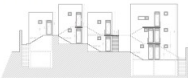
Prospetto degli edifici - fronte in legno/ Elevation of buildings - wooden front.