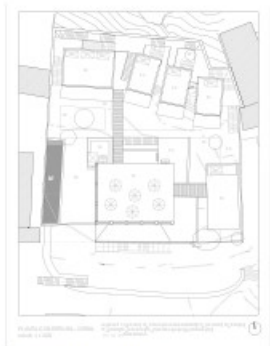
Pianta generale del piano terra e delle coperture/General plan of the ground floor and the roofs.