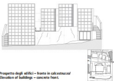
Prospetto degli edifici - fronte in calcestruzzo/ Elevation of buildings - concrete front.